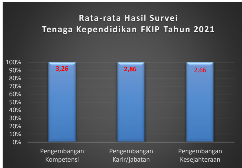
Grafik 3.1 Rata-rata Hasil Survei Tenaga Kependidikan FKIP Universitas Almuslim tahun 2021

merasa memuaskan dengan pelayanan yang diberikan oleh FKIP Universitas Almuslim tahun 2020. Adapun hasil survei kepuasan tenaga kependidikan FKIP Universitas Almuslim tahun 2021 secara jelas dapat dilihat pada grafik berikut.